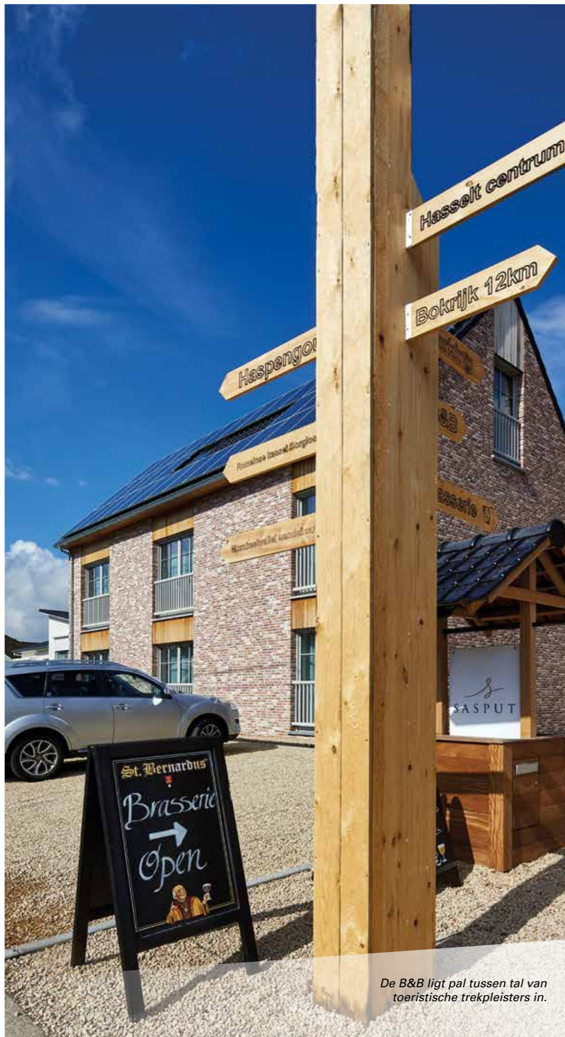
De B&B ligt pal tussen tal van toeristische trekpleisters in.

van Veldeman, hét Belgische bed bij uitstek. Alle kamers beschikken over een minibar. Sommige beschikken over een douche, andere over een combinatie van een bad met douche. Eén van de kamers is volledig aangepast aan personen met een beperking. Zowel voor de B&B als de Sasserie kozen we voor een inrichting die net een beetje anders is, maar zeker niet overdreven. Zo is er op elke kamer een accentmuur met opvallend reliëfbehang.'